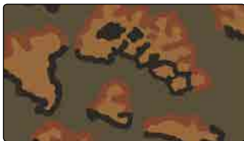
EICHENLAUBMUSTEFOGLIA DI QUERCIA (PRIMAVERA)