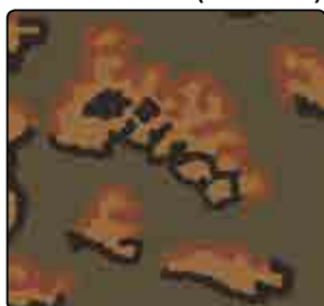
FOGLIA DI QUERCIA (AUTUNNO)