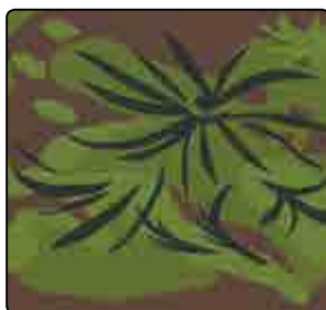
FOGLIA DI PALMA (PRIMAVERA)