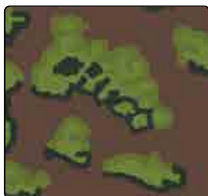
FOGLIA DI QUERCIA (PRIMAVERA)