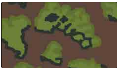
EICHENLAUBMUSTER FOGLIA DI QUERCIA (PRIMAVERA)