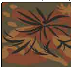
FOGLIA DI PALMA (AUTUNNO)